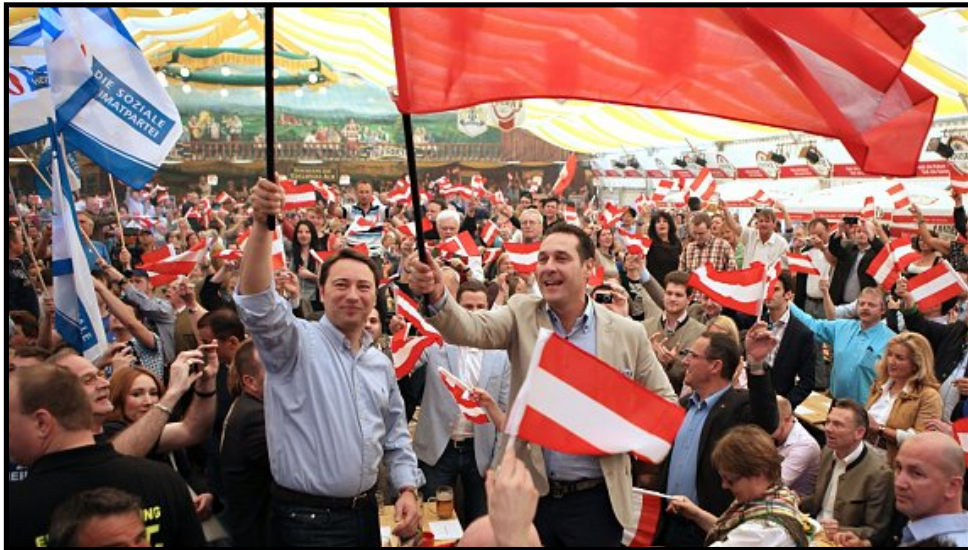
FPÖ Veranstaltung Salzburg 2013