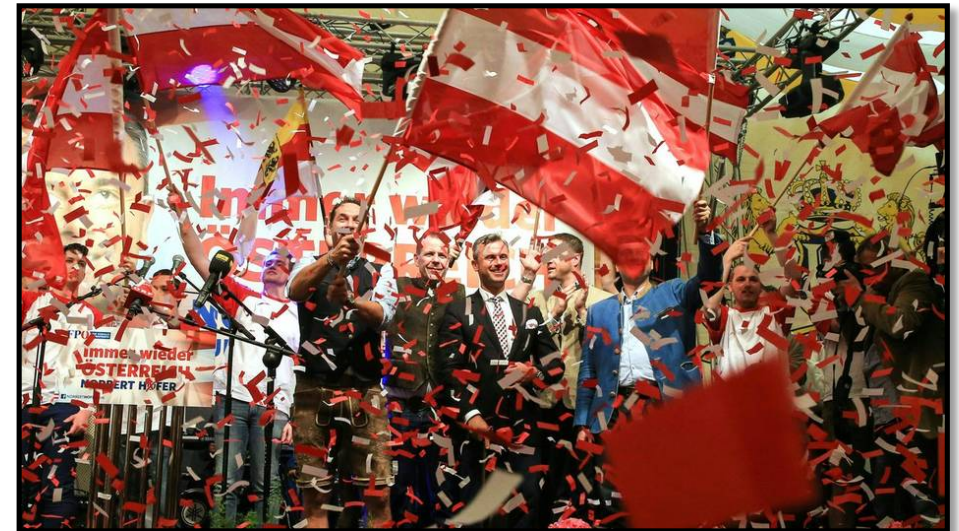
FPÖ Veranstaltung Linz 2016