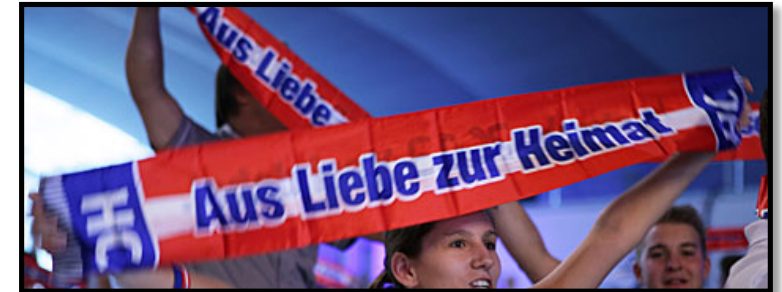
FPÖ Veranstaltung Linz 2017 (ORF OÖ) - https://goo.gl/images/rPy424