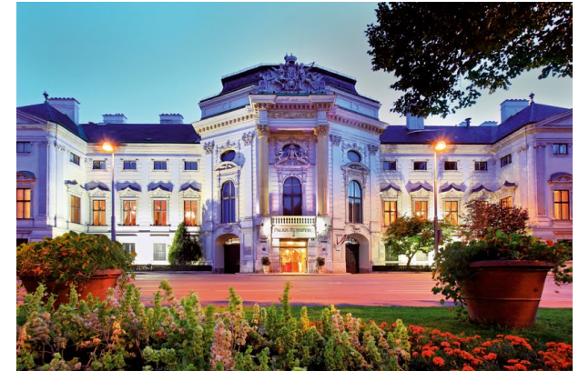
Palais Auersperg