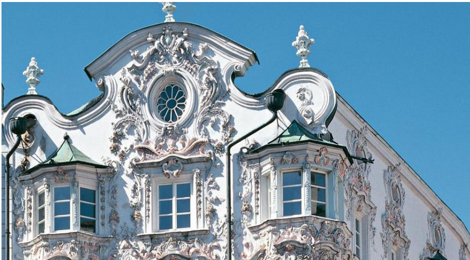
Helblinghaus Innsbruck