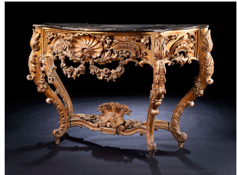
italienischer Wandkonsoltisch – Quelle: https://goo.gl/images/MhHP5c