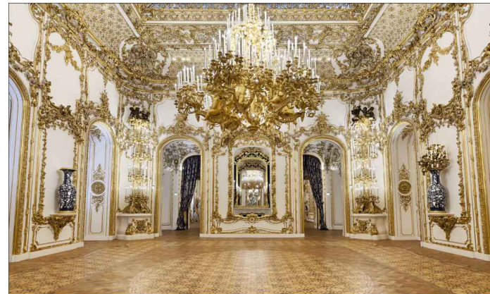
Palais Liechtenstein Prunksaal – Quelle: https://goo.gl/images/Rd7ha5